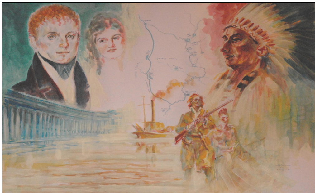
Il Mondo di Giacomo Costantino Beltrami

"...Misera Italia! Oppressa dalla tirannia, oscurata dall'ignoranza, lacerata dalla invidia!..." GIACOMO COSTANTINO BELTRAMI (BERGAMO 1779 – FILOTTRANO 1855): UN MISCONOSCIUTO PATRIOTA ITALIANO PREUNITARIO