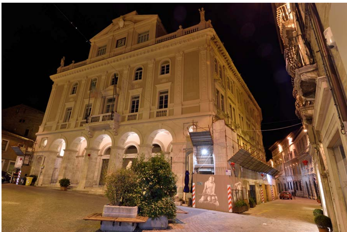
Piazza Cesare Battisti e il Palazzo degli Studi