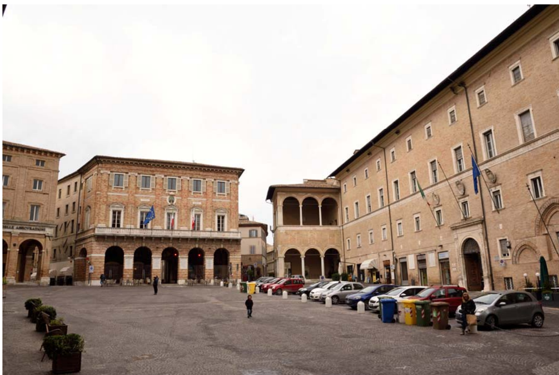
Piazza della Libertà