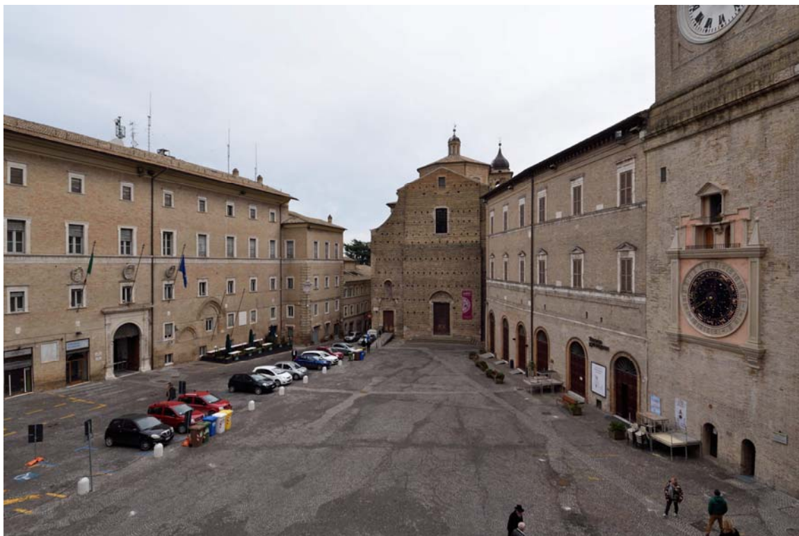
Piazza della Libertà