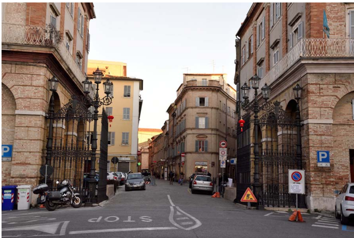
Piazza Annessione e i Cancelli