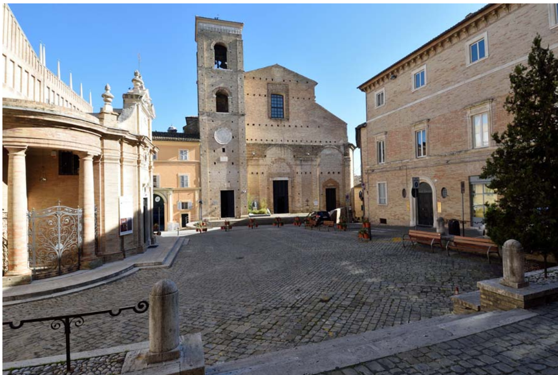
Piazza Strambi e il Duomo