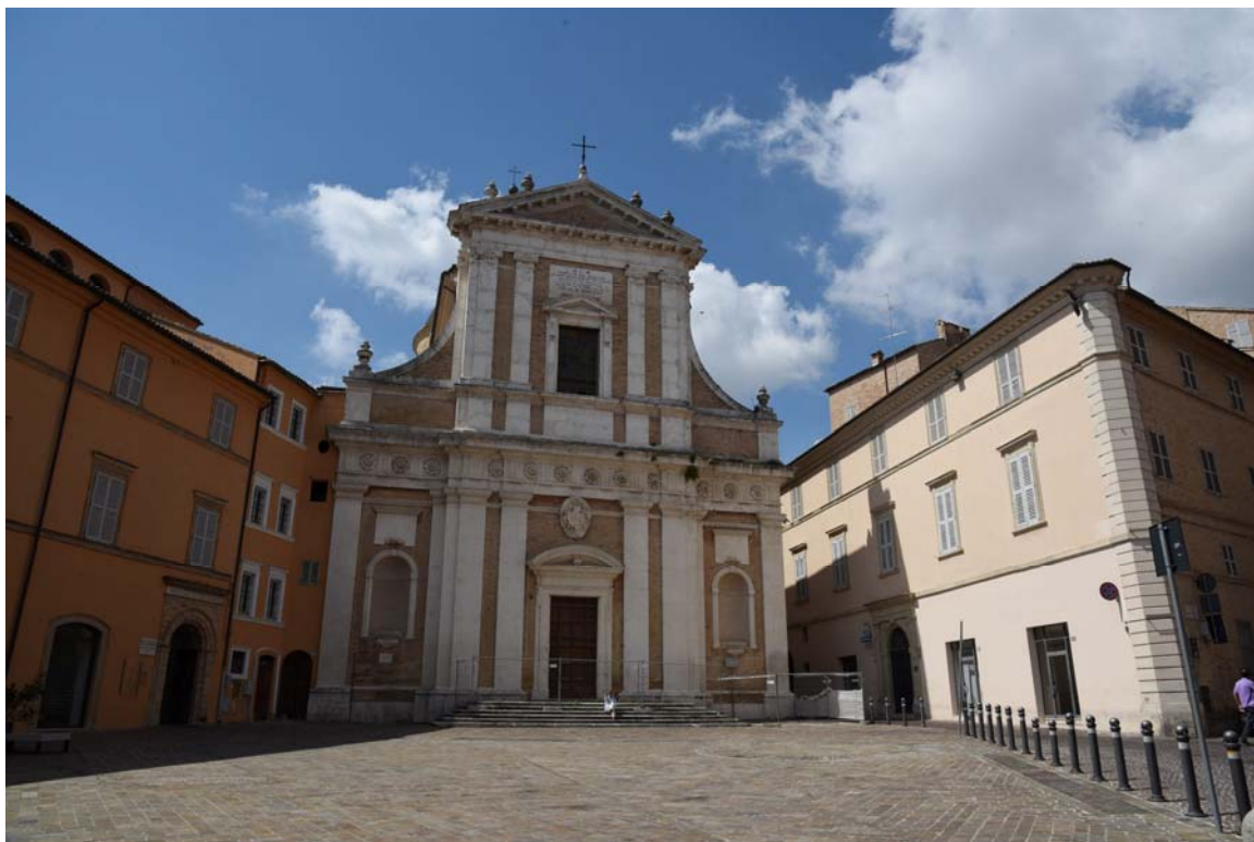
Piazza Vittorio Veneto