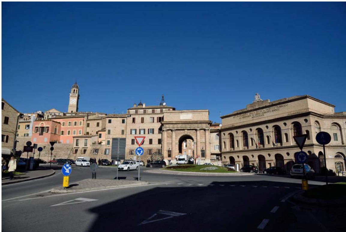
Piazza Nazario Sauro