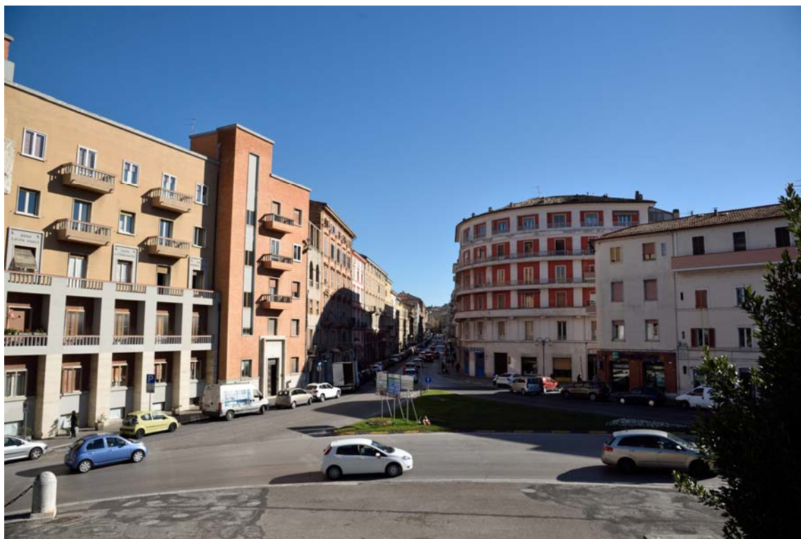
Piazza della Vittoria