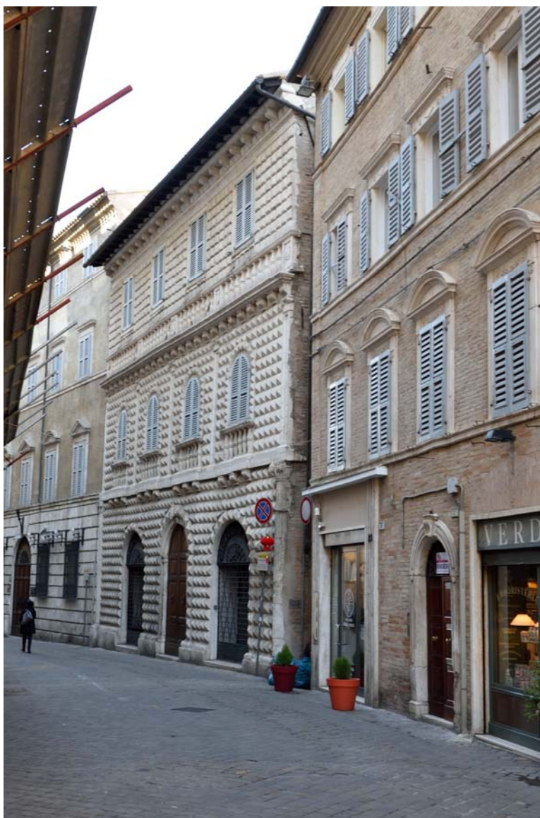
Palazzo dei Diamanti