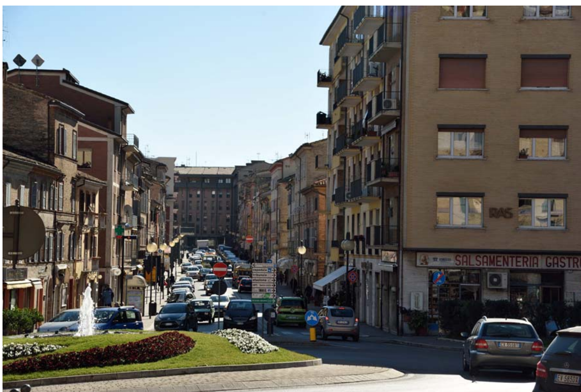
Piazza Nazario Sauro e Corso Cairoli