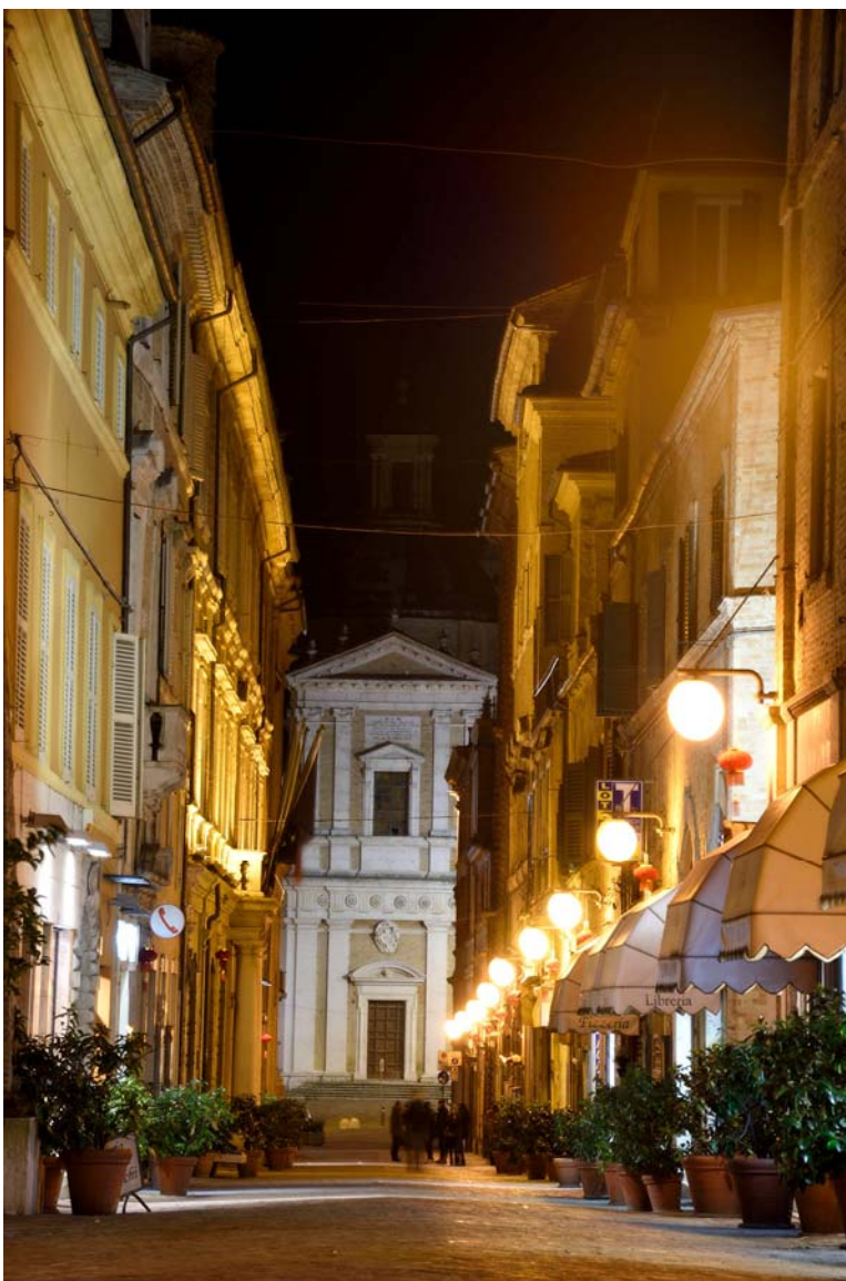
Corso della Repubblica