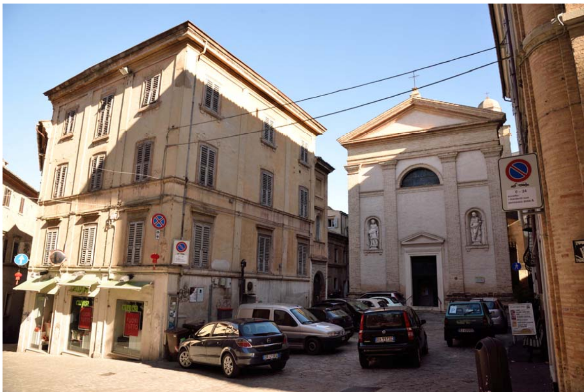
Piazza XXX Aprile e Chiesa di San Giorgio