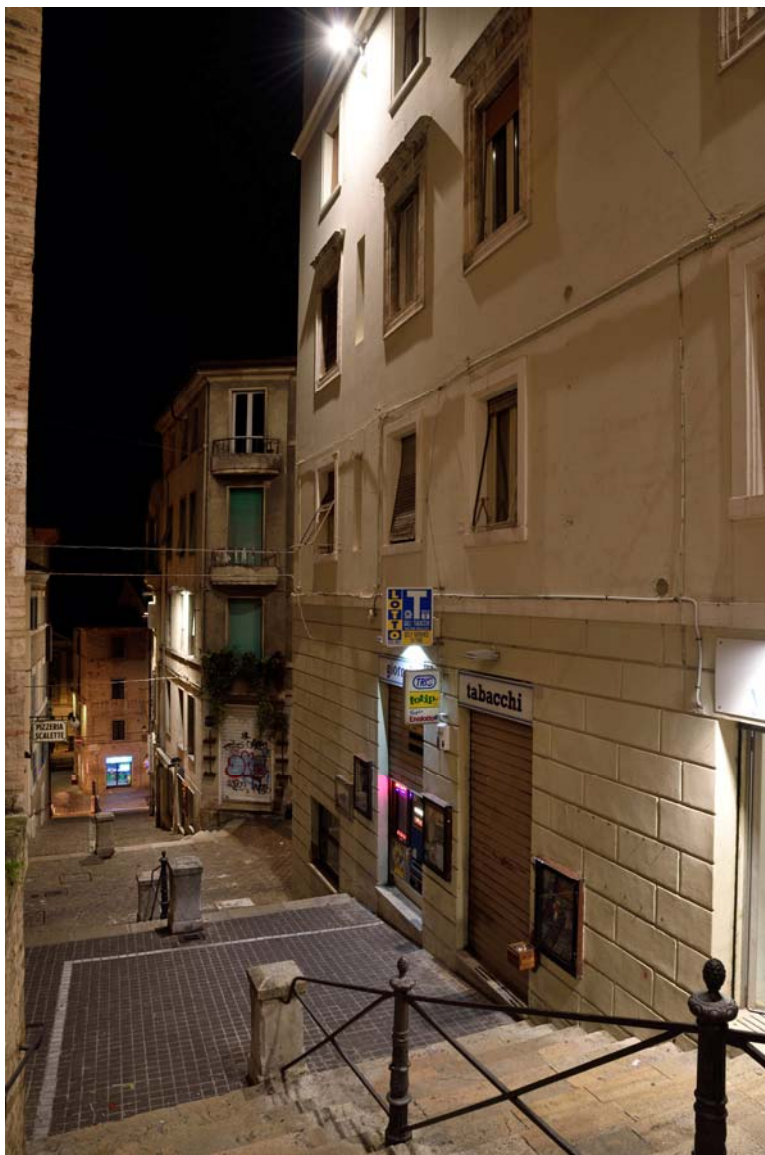
Piaggia della Torre