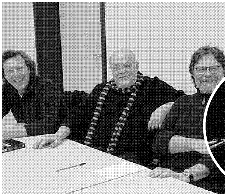
MUSICA Ellade Bandini, Giorgio Cordini e Mario Arcari. Nel tondo De Andrè