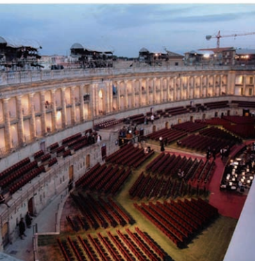
Sferisterio - interno