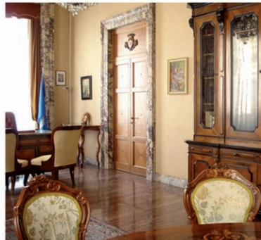
studio del Sindaco

Misteri da svelare... lungo il percorso.