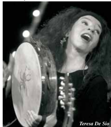
Teresa De Sio

Protagoniste indiscusse della tre serate di Musicultura saranno la musica, la parola, la voce, per uno spettacolo in bilico tra ricerca e tradizione, aperto alla contaminazione di codici espressivi diversi. Tra i