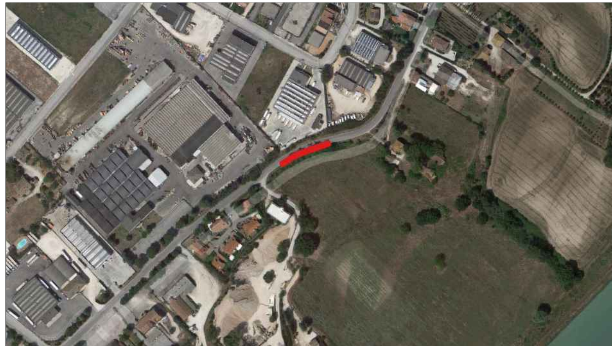
Via Calcutta secondo tratto - Area di intervento