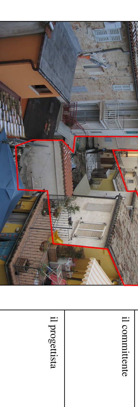
Tavola 2 Int. Scale: 1:100 Il committente: Data: Gennaio 2011 Il progettista:

Il progettista: PAOLO MARGIONE STUDIO ASSOCIATO ARCHITETTURA Via S. Maria Maddalena, 10 - 06100 Macerata (MC) Tel. 0733/282111 - Fax 0733/282112 www.paolomargione.it