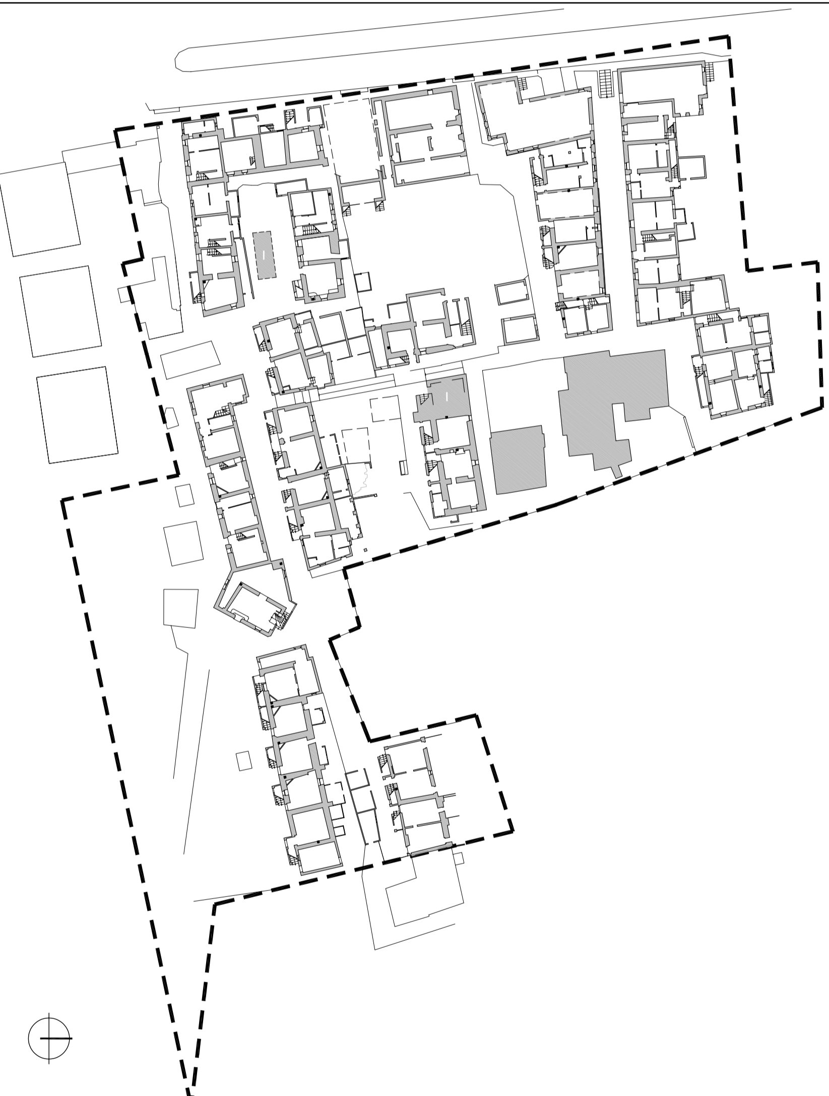
ESTRATTO DA PLANIMETRIA CATASTALE, SCALA 1:1000