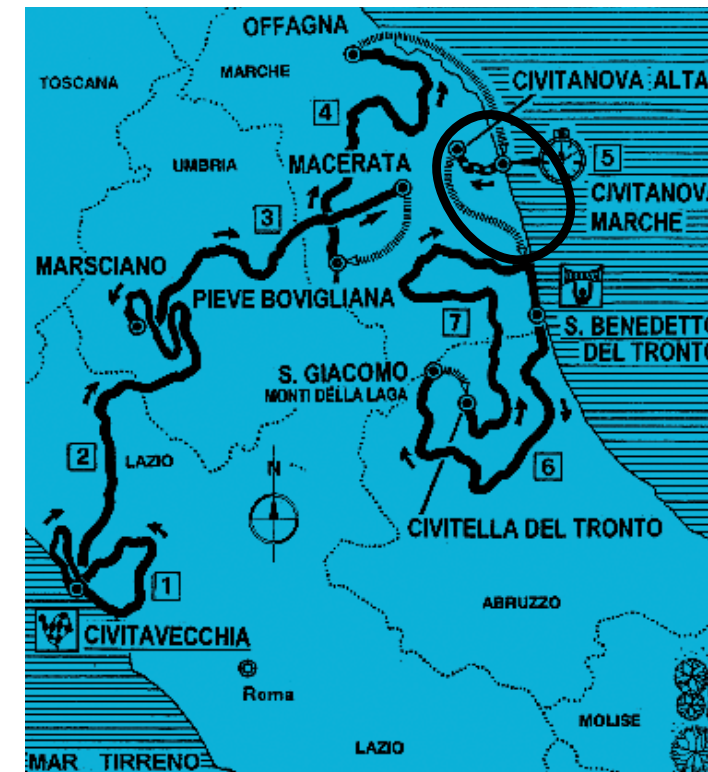
TABELLA DI MARCIA

L'orario di passaggio dei ciclisti nelle varie località indicate in tabella è stimata in base a tre possibili medie di velocità: 38Km/h, 40 Km/h e 42 Km/h