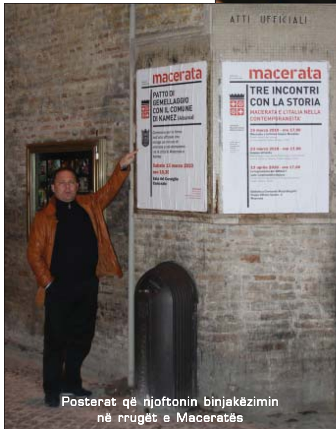
Posterat që njoftonin binjakëzimin në rrugët e Maceratës

hedhur nga Meschini për zhvillimin e një turneu futbollit në mes të rinjve jo vetëm të Kamzës e Maceratës por edhe me dy qytete e tjera të binjakëzuara me Maceratën, Weiden in der Oberpfalz , Gjermani, Issy-les-Moulineaux , Francë dhe Floriana, Maltë .