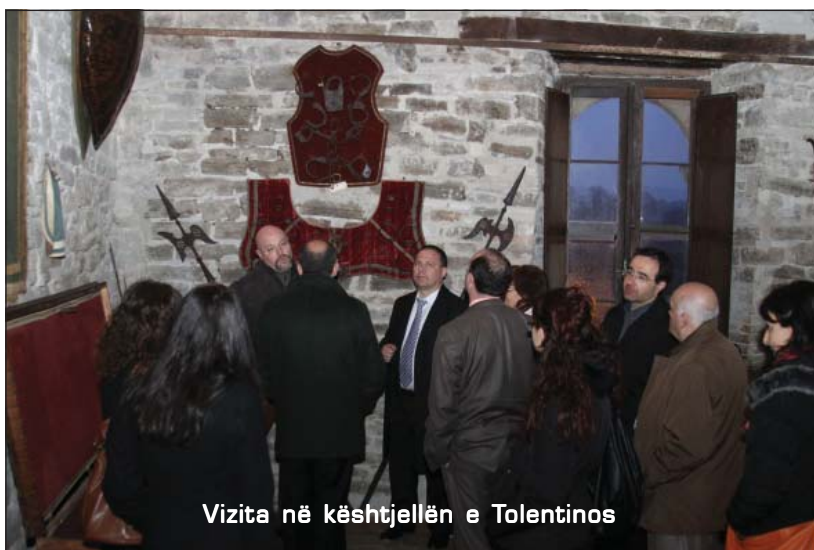
Vizita në kështjellën e Tolentinos

"Në këtë ditë marrim solemnisht angazhimin të vendosim dhe të mbajmë marrëdhëniet të vazhdueshme ndërmjet administratave tona, por mbi të gjitha ndërmjet popujve tanë përkatës, me qëllimin për të arritur një mirëkuptim reciprok me të mirë, një bashkëpunim efikas, një ndjenjë të thellë për fatin tashmë të përbashkët, e kështu, një ndihmë reciproke në përbashkëpunimin e problemeve administrative, ekonomike, sociale e kulturore, duke zhvilluar solidaritetin dhe pjesëmarrjen e të gjithë atyre që jetojnë e punojnë në komunitetet tona; të bashkojmë përpjekjet tona për të mbështetur me të gjitha mjetet suksesin e kësaj nisme, vazhdimësinë e këtyre lidhjeve paqeje e prosperiteti."