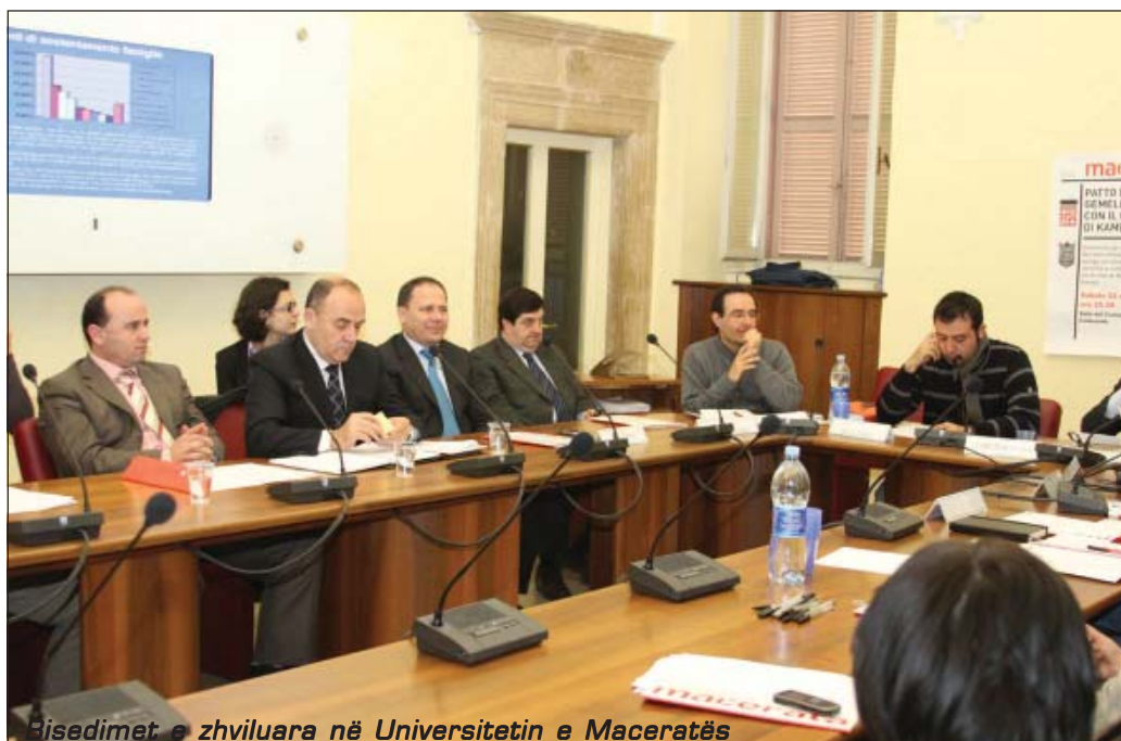
Bisedimet e zhvilluara në Universitetin e Maceratës