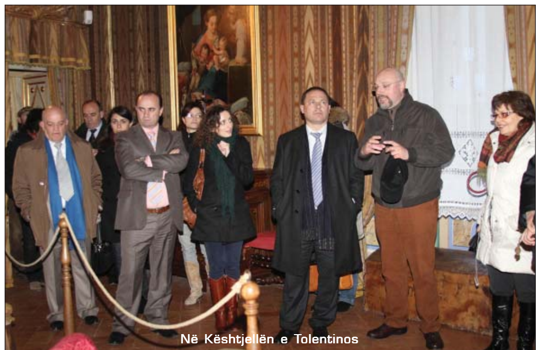
Në Kështjellën e Tolentinos