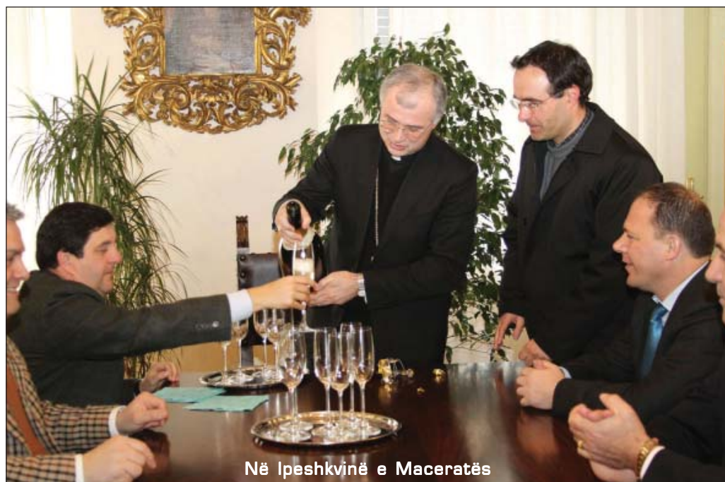
Në Ispshkinë e Maceratës

Gjithsesi, banorët e asaj zone njiheshin për njerëz punëtorë dhe shumë