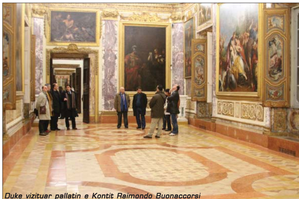
Duke vizituar pallatin e Kontit Raimondo Buonaccorsi