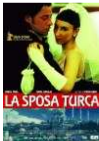
La sposa Turca, 2004 (Germania)

Il Cineforum organizzato dal Comitato per le Pari Opportunità dell' Università di Macerata - dopo aver affrontato i temi della famiglia e, lo scorso anno, quello dell'adolescenza - volge lo sguardo quest'anno alla realtà dell'immigrazione e dell'integrazione fra culture. Giovedì 6 aprile è la volta di La sposa turca (2004, Germania) , storia di un uomo e una donna, entrambi di origine turca in Germania, accomunata da un profondo e disperato desiderio di evasione.