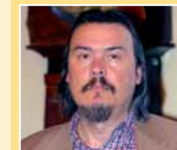
Lorenzo Marconi vice sindaco

Biografia Nato a Macerata il 7 febbraio 1956 è laureato in ingegneria nucleare ed è libero professionista. E' stato consigliere ed assessore nel Comune di Macerata dal 1985 al 1993. Eletto nel Consiglio regionale delle Marche nella legislatura 1995-2000, è stato presidente della commissione consiliare "Lavori pubblici e ambiente", nonché capogruppo consiliare dei Popolari. E' stato sindaco di Macerata nella legislatura 2000-2005. E' presidente della Conferenza permanente regionale socio sanitaria, della Conferenza dei sindaci della zona territoriale n. 9 e del Comitato dei sindaci dell'Ambito sociale n. 15 Macerata. E' componente del Comitato regionale di indirizzo dell'Arpm designato dall'Anci, nonché della Conferenza regionale delle autonomie e del Consiglio di amministrazione dell'Università di Macerata.