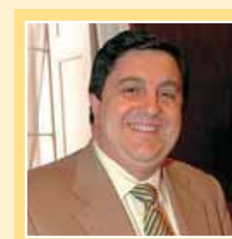
Giorgio Meschini sindaco

mento atmosferico si solleciterà la riduzione dell'uso dell'auto privata anche attraverso le Domeniche senz'auto. Rispetto invece all'inquinamento acustico si procederà all'applicazione della normativa che prevede la redazione del piano di zonizzazione acustica della città e la realizzazione delle nuove abitazioni con criteri di isolamento acustico. Infine l'inquinamento elettromagnetico va tenuto sotto stretto e costante monitoraggio per mantenere e, ove possibile, migliorare l'attuale situazione applicando il regolamento e il piano di localizzazione degli impianti che il Comune si è dato.