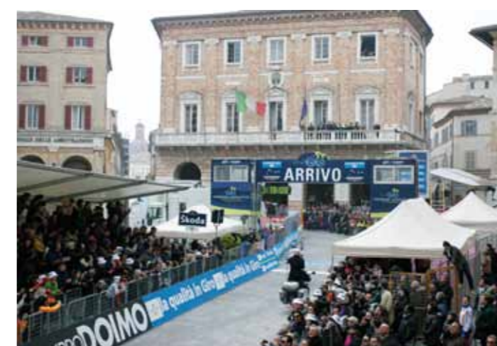
L'arrivo di fronte al palazzo del municipio