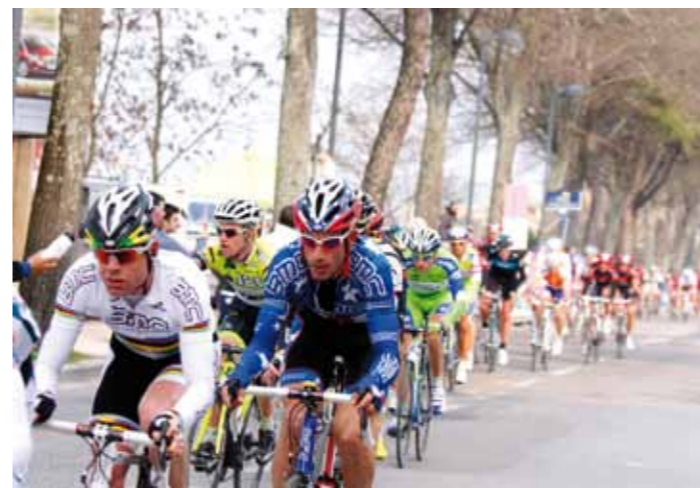
Passaggio in viale leopardi