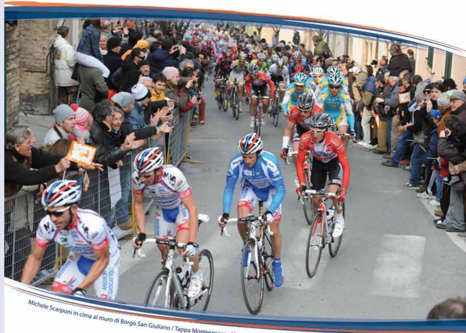
Michele Scarponi in cima al muro di Borgo San Giuliano / Tappa Montecosaro - Macerata 2010