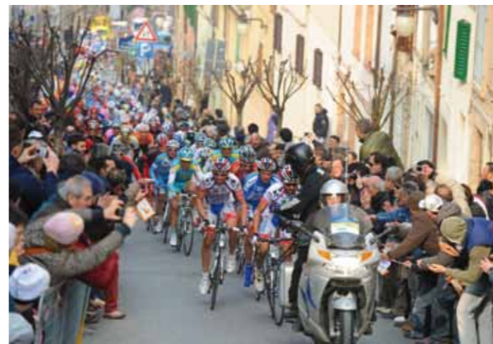
Il gruppo sulla salita di borgo san giuliano

Immagini della 45° Edizione 2010 / Tappa Montecosaro - Macerata