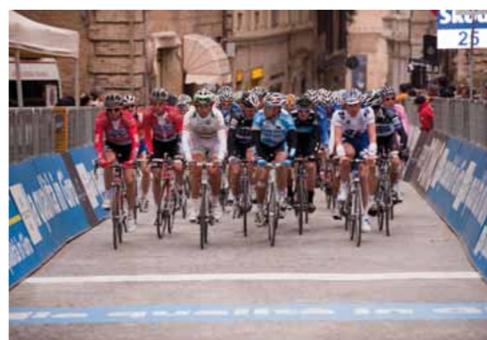
Il gruppo al traguardo in piazza della libertà