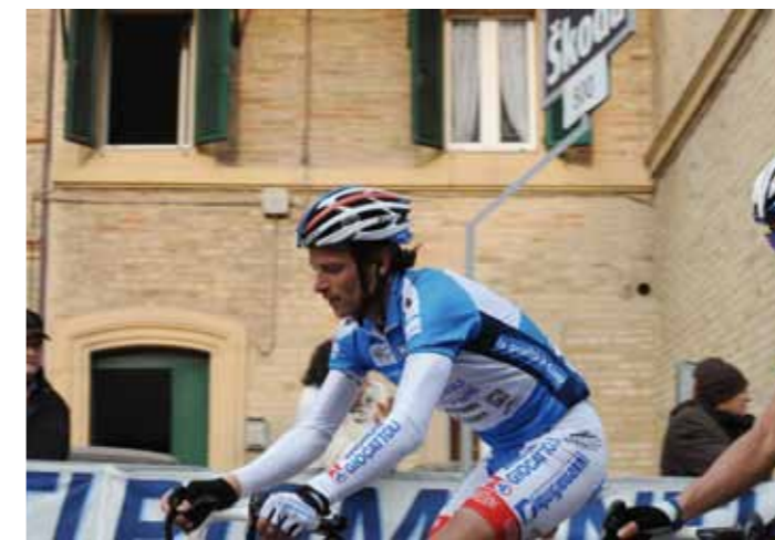
Michele Scarponi all'arrivo in piazza della libertà