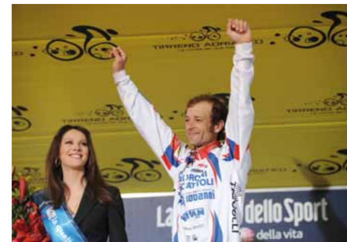
Michele Scarponi sul podio in piazza della libertà