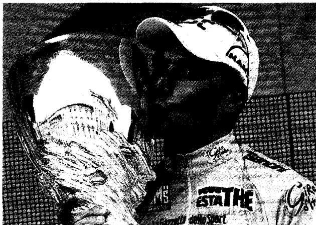
Ivan Basso, uno dei più attesi alla Tirreno-Adriatico