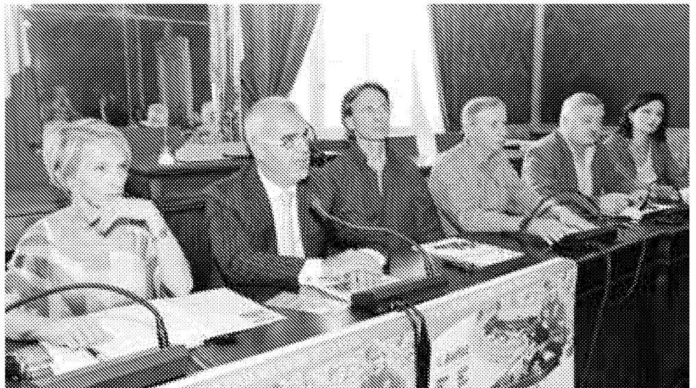
La presentazione della manifestazione benefica ieri nella sala del Consiglio

E' diventato ormai un appuntamento fisso. E' Kartisti 2011 che torna domenica 18 settembre, e per la prima volta si svolgerà nel circuito cittadino allestito ai Giardini Diaz, già utilizzato per il campionato europeo di pattinaggio. La manifestazione, organizzata dall'Anffas di Macerata in collaborazione con Rock No War, vedrà sfidarsi in gokart numerosi personaggi del mondo dello spettacolo in nome del progetto della Casa Famiglia Anffas a Macerata. Nel circuito cittadino allestito ai giardini Diaz prenderanno parte alla gara di kart l'attore Cesare Bocci, fonte d'ispirazione dell'iniziativa, l'ex miss Italia Francesca Chillemi, Massimo Ghini, Primo Reggiani, Dennis Fantina, Marco Basile, e ancora Daniele Pecci, Sebastiano Somma, Antonello Fassari e Daniela Scarlatti. Kartisti 2011 è stata presentata ieri nella sala consiliare del Comune dal sindaco Romano Carancini, l'attore Cesare Bocci, l'assessore allo Sport Alferio Canesin, Paola Giorgi la vice presidente dell'Assemblea Legislativa delle Marche, partner dell'iniziativa, Mario Sperandini, presidente dell'Anffas Macerata e dal vice presidente Marco Scarponi. L'appuntamento si aprirà domani sera con la cena di ben-