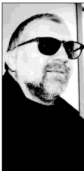
Lo psichiatra e criminologo Massimo Picozzi sarà stasera a Macerata

L'iniziativa è organizzata dall'associazione Praxis in collaborazione con l'assessorato ai Servizi sociali del Comune e della Provincia e parte dal presupposto che la diffusione sempre più ampia dei disturbi mentali esiga un'opera di prevenzione volta ad evitare l'insorgenza del disagio. A questo scopo sono stati organizzati incontri a tema e promosse consulenze gratuite con i professionisti che aderiscono all'iniziativa.